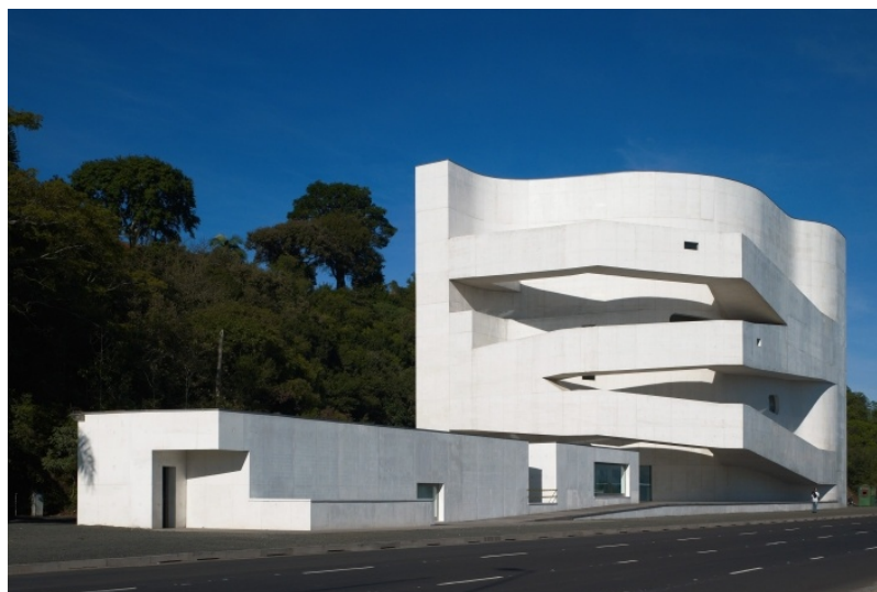
Fundação Iberê Camargo. Porto Alegre - RS.

Iberê Camargo chegou a ter seu trabalho reconhecido em vida. Recebeu prêmios e expôs suas obras no Brasil e no exterior. Quando falece em 1994, deixa a obra Solidão incompleta (obra acima). Um ano depois de sua morte, é inaugurada a Fundação Iberê Camargo, na cidade de Porto Alegre. Atualmente, a Fundação é um dos principais museus da cidade.