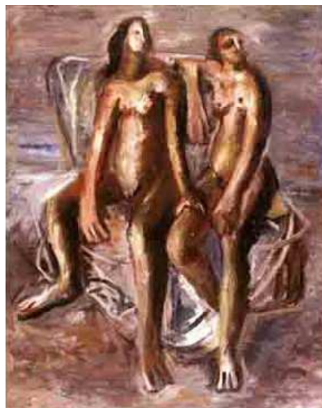
Sem título. Iberê Camargo. 1945.

O artista também se interessava em representar figuras humanas e, principalmente, as inquietações do ser humano. Com o passar do tempo, suas obras foram se tornando cada vez mais abstratas e menos realistas. Passou a representar com frequência em suas pinturas objetos como dados e carretéis de linha. Os carretéis se tornaram um símbolo de seu trabalho.