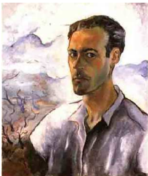
Autorretrato. Iberê Camargo. 1943.

Anos depois, o artista estudou pintura na Itália e na França, onde foi aluno de artistas como Guignard e Lhote. Nesse período, teve contato com a arte modernista europeia, que influenciou suas obras.