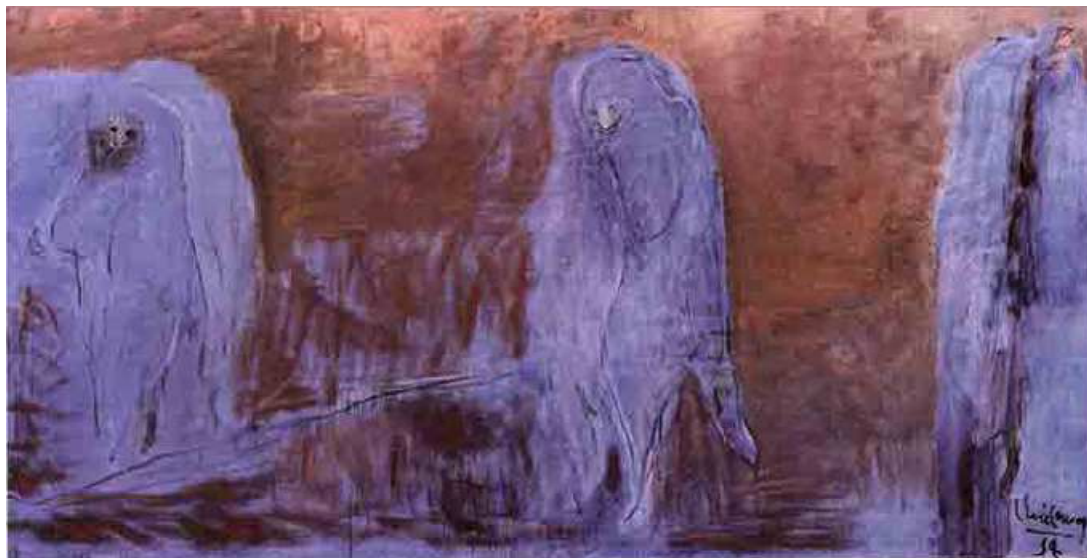
Solidão . Iberê Camargo. 1994.

Os críticos de arte consideram que o estilo de suas obras era o Expressionismo Abstrato. Expressionismo, porque suas obras lembram o movimento artístico expressionista, já que possuem cores mais escuras, apresentam certa melancolia e pessimismo e retratam as dores e misérias humanas. E Abstrato, porque suas obras não eram realistas, ou seja, não tentavam representar a realidade tal como ela é.