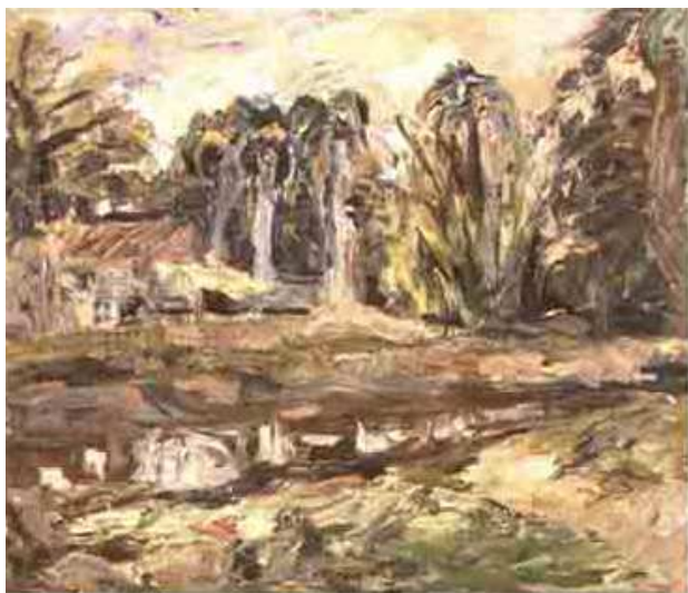
Sem título. Iberê Camargo. 1941.

Iberê Camargo é um artista gaúcho, nascido em 1914 e responsável pela criação de diversas pinturas e gravuras. No início de sua carreira, teve formação em pintura e arquitetura no Rio Grande do Sul e, anos mais tarde, estudou pintura no Rio de Janeiro. O principal tema de suas primeiras obras eram paisagens. Embora no início suas obras fossem mais realistas, já era possível ver nelas características da arte abstrata.