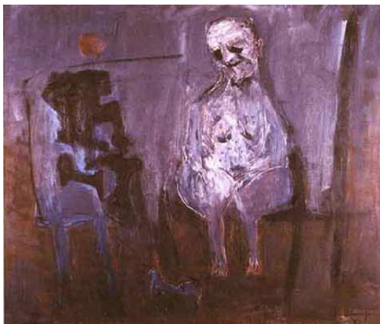
Tudo Te é Falso e Inútil I. Iberê Camargo. 1992.