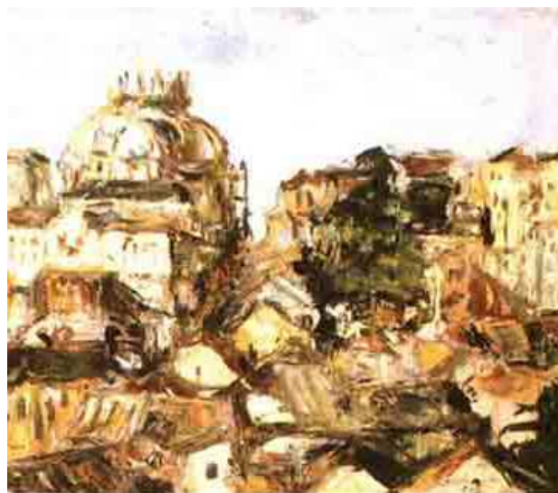
Sem título. Iberê Camargo. 1942.