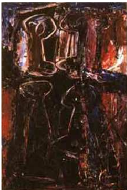
Composição. Iberê Camargo. 1982.

O artista também se interessava em representar figuras humanas e, principalmente, as inquietações do ser humano. Com o passar do tempo, suas obras foram se tornando cada vez mais abstratas e menos realistas. Passou a representar com frequência em suas pinturas objetos como dados e carretéis de linha. Os carretéis se tornaram um símbolo de seu trabalho.